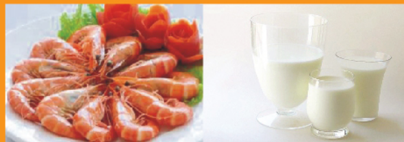
Tôm biển: 152mg/100g Nội tạng