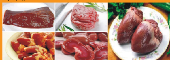
Tim lợn: 131mg/100g - Bầu dục lợn: 319mg/100g