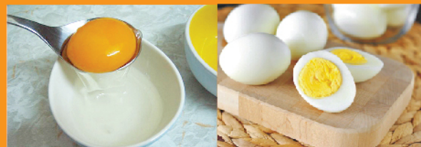
Lòng đỏ trứng gà: 200mg/ 1 lòng đỏ