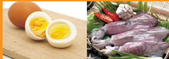
Trứng gà: 235mg/ 1 quả